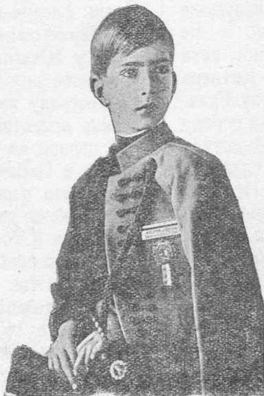
Й. В. Краљ Петро II

На сами дзень торжества служели ше пред поладньом у церквох шицких вирох (як муслиманскей, так християнских и жидовскей) богослуженија за живот и щесце милого нам Краля, а так исто пред поладньом у вельких местох нашей Югославји отримовали ше јавни приказанија нашей войски и ей наоружанија (реви трупох). Ту ше могло видзиц же нашо войско духом и целом и з наоружаньом тельо моцне, же ше ей и наша надја, наш мили Краљ, може спокойно рихтац за свою високу длужносц. Торжество того дня було вельке у цалей Югославји. А ми, югославјански Русини, модлели зме ше Богу и нешка ше модлїме, да нам зачува нашего милого Краля, да нам го длуго поживи, и да го обдари зос мудросцу и шицкими ласками Божима, да Вон поведзе моцно, швижо и мудро нашу державу до велького на-